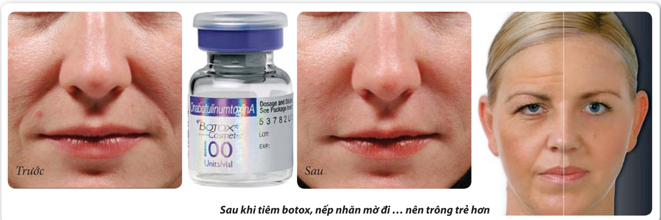
Sau khi tiêm botox, nếp nhăn mờ đi... nên trông trẻ hơn

Người Mỹ sử dụng botox nhiều nhất thế giới. Các ngôi sao Hollywood chính là những người khiến dịch vụ làm đẹp bằng botox thực sự nở rộ. Theo Hiệp hội Phẫu thuật Tạo hình Thẩm mỹ Mỹ, năm 2011, có 1,6 triệu người tiêm botox tại Mỹ, đưa botox trở thành công nghệ làm đẹp hàng đầu ở nước này. Cả nam giới cũng bắt đầu "mê mẩn" botox với nhu cầu sử dụng tăng vọt đến 200% trong 5 năm gần đây. Độ tuổi nam giới